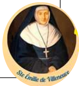
Ste Emile de Villeneuve