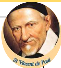
St Vincent de Paul